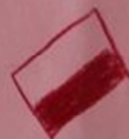
„Życzenia dla Polski”