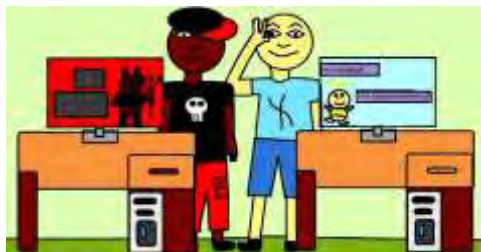
Czy widzisz różnice???

Naszym zadaniem nie jest wywoływanie dyskusji na ten temat, a tylko przypomnienie, że także na tym polu działalności naszych dzieci musimy zapewnić im bezpieczeństwo. Może tych kilka rad pomoże w tym państwu.